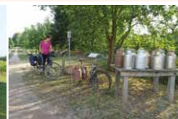
Milchbank in Heidenau