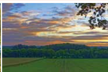
Stressfrei Radeln mit Weitblick