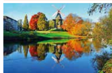
Bremer Mühle am Wall