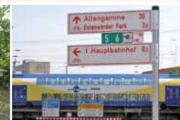
Mit dem Metronom zurück nach Hause