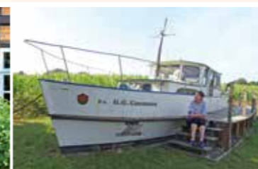
Nartumer Hafen ganz im Grünen