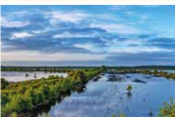
Weite Wasserflächen des Tister Bauernmoores