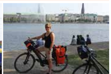
Hamburgs Binnenalster, ein lohnendes Ziel