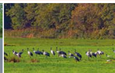
Kraniche rasten zur Vogelzugzeit im Frühjahr und Herbst an der Route