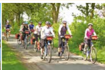
Mit Freunden unterwegs