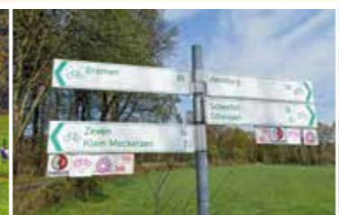
Hier geht es lang