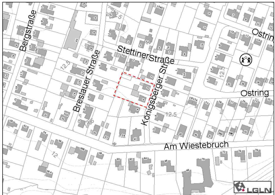
Abb. 1: Räumliche Lage des Plangebietes (Geltungsbereich rot gestrichelt umrandet)