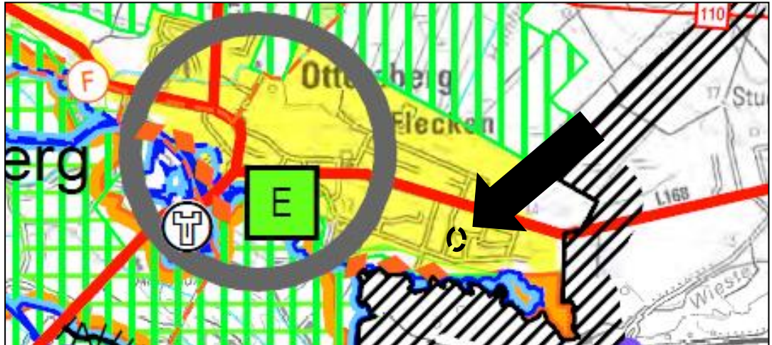
Abb. 3: Ausschnitt aus dem RROP Verden 2016; Plangebiet schwarz gestrichelt markiert

Die zeichnerische Darstellung der 1. Änderung des RROP Verden enthält keine Inhalte die den Geltungsbereich des Plangebietes betreffen.