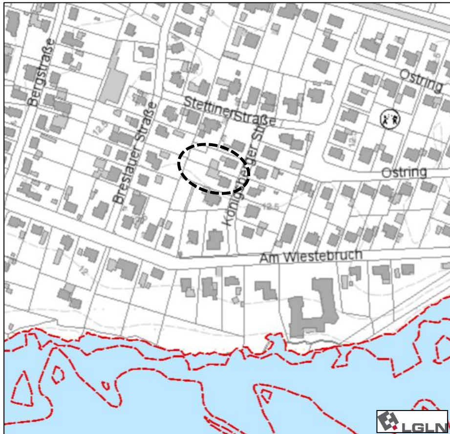
Abb. 4: vorläufig gesichertes Überschwemmungsgebiet Niedersachsen; Plangebiet schwarz gestrichelt umrandet; Quelle: Umweltkarten Niedersachsen